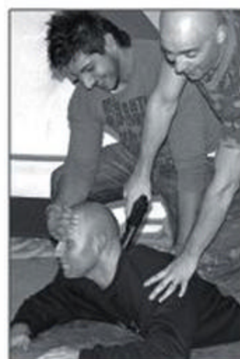
Mit allen Konsequenzen: Auch Schießübungen standen für die zwölf Teilnehmer auf dem Programm – und das Überwältigen eines Angreifers.